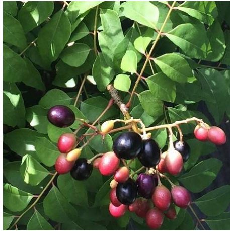
9 Murraya koenigii