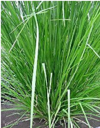
8 Vetiveria zizanoides