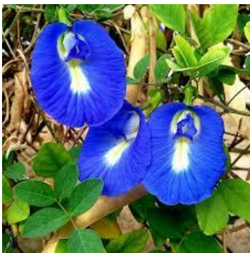
5 Clitoria ternatea