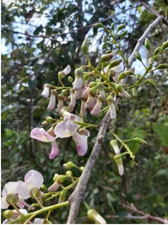
2 Glyricidia Szpium

Principalement composé de Plantes à parfum aromatiques et médicinales, idéalement sur plusieurs rangés.