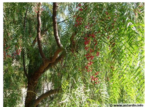
3 Schinus molle

Je dispose du matériel végétal de toutes ces espèces, actuellement