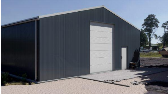
Hangar de stockage H1213-40