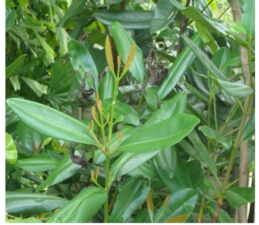
1 Pimenta Racemosa