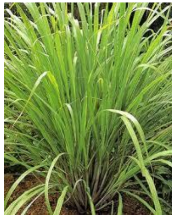
7 Cymbopogon citratus