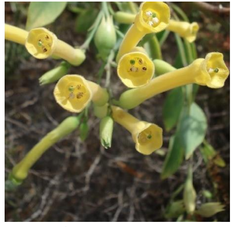
6 Nicotina Glauca