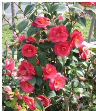
4 Camellia Japonica