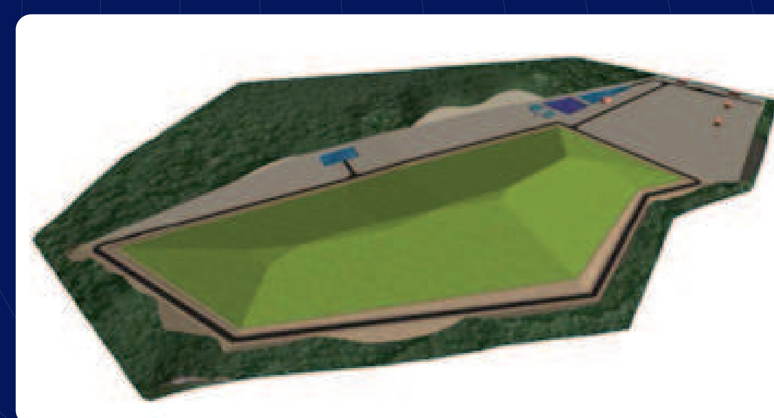
Représentation 3D de l'ISDND exploitée et réaménagée

Après exploitation, le site fera l'objet d'un suivi sur 30 ans. On pourra alors envisager une remise en état naturel.