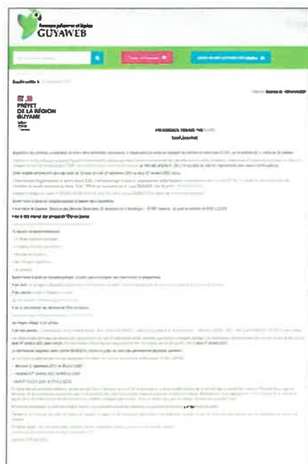
Avis paru à Guyaweb le 24 septembre 2021

Conformément à l'article R. 131-6 l'avis d'enquête publique a été publié au journal d'annonce légale dématérialisé « Guyaweb » le 10 septembre 2021 et le 24 septembre 2021.