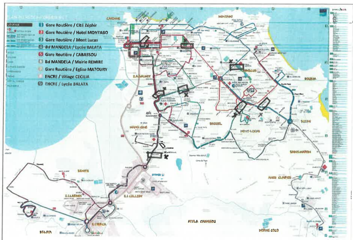
Plan d'affichage des avis d'enquête publique