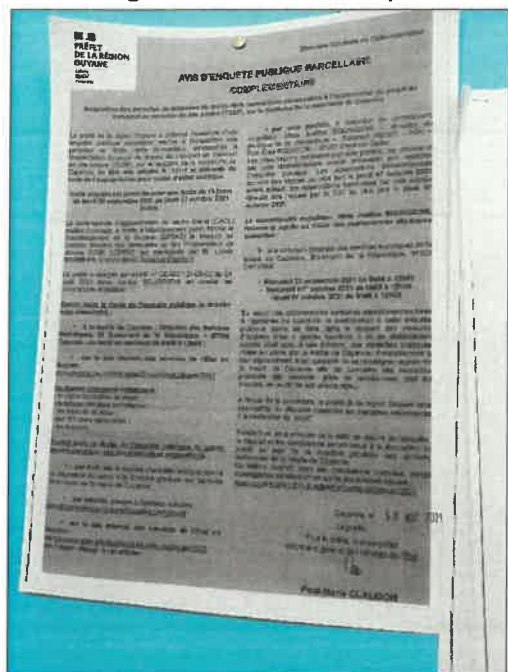
Photos prises par le commissaire enquêteur au sein des locaux des services techniques de la mairie de Cayenne.

L'avis d'enquête publique a fait l'objet d'un affichage conforme aux dispositions réglementaires du 14 septembre 2021 au 8 octobre 2021 en mairie de Cayenne (annexe n°2)