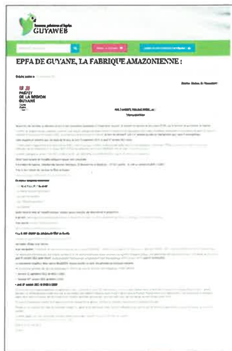
Avis paru à Guyaweb le 10 septembre 2021