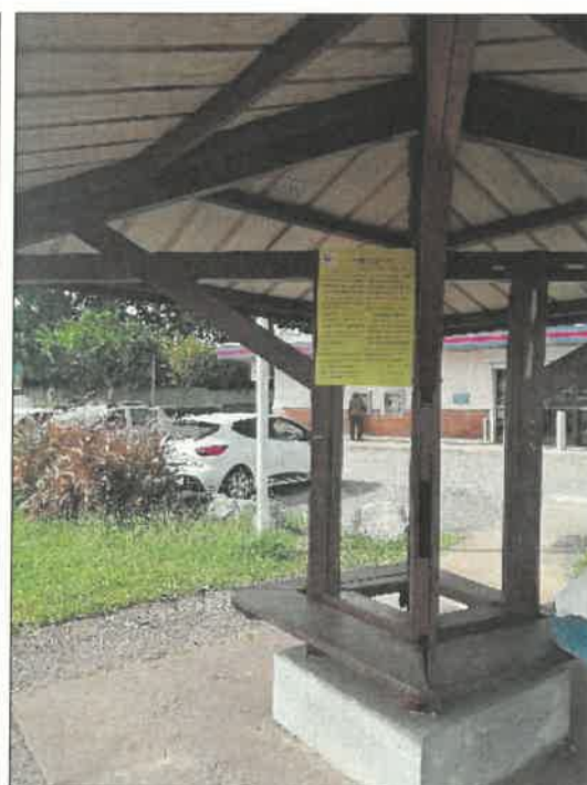
Photos prises par le commissaire enquêteur à l'arrêt Korossol