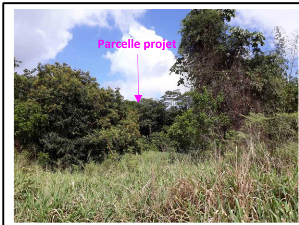
Vue depuis la parcelle 813 au sud