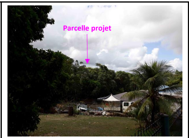
Vue depuis point haut lotissement Canella au nord