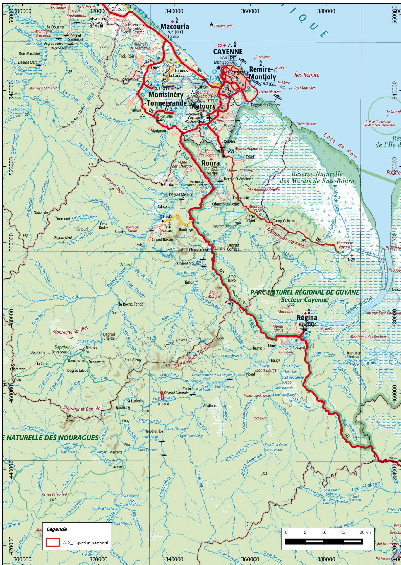
Carte de situation de l'AEX « crrique La Boue aval » de l'EURL SAINT-GEORGES d'après la carte IGN au 1/500 000° en RGF95 UTM22