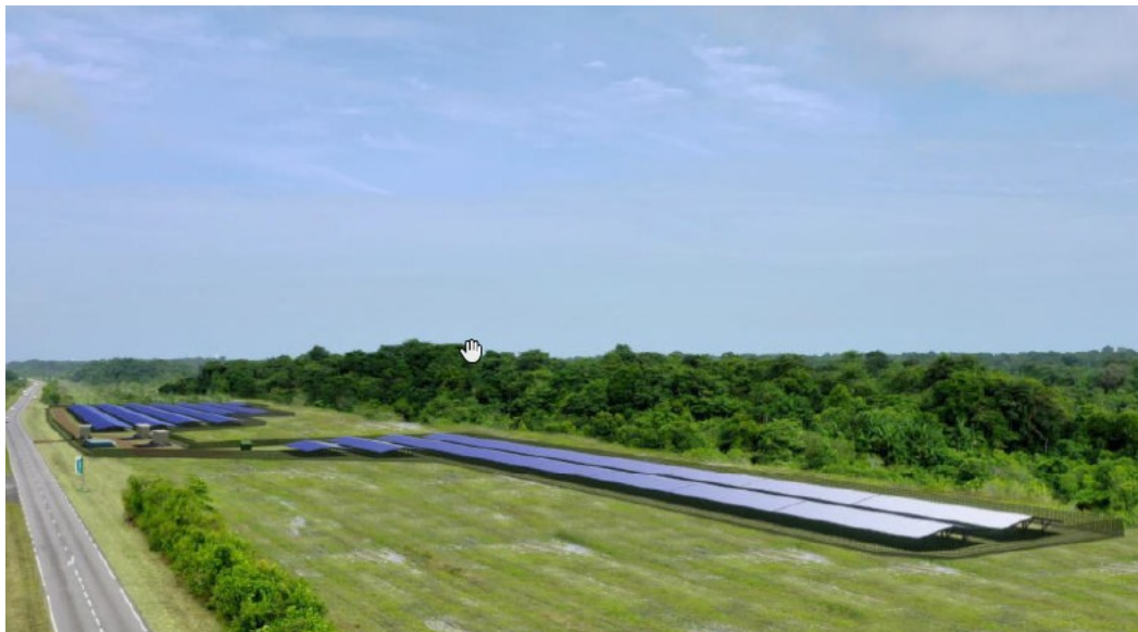
Figure 4 : Situation du projet par rapport à la route de l'espace

Le paysage présentant actuellement dans ce secteur une ambiance savanicole et forestière va être modifié par les aménagements et constructions liés au projet, et l'installation du parc à proximité immédiate de la route. La zone étant dépourvue d'habitation, la gêne visuelle occasionnée est limitée, du fait également de la présence de masques de végétation entre la route et le projet. Mais il subsiste des points de visibilité du projet depuis la route de l'espace, ainsi que depuis le bâtiment EPCU S5 situé de l'autre côté de la route.