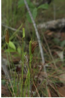
Figure 5 : Actinostachys pennula