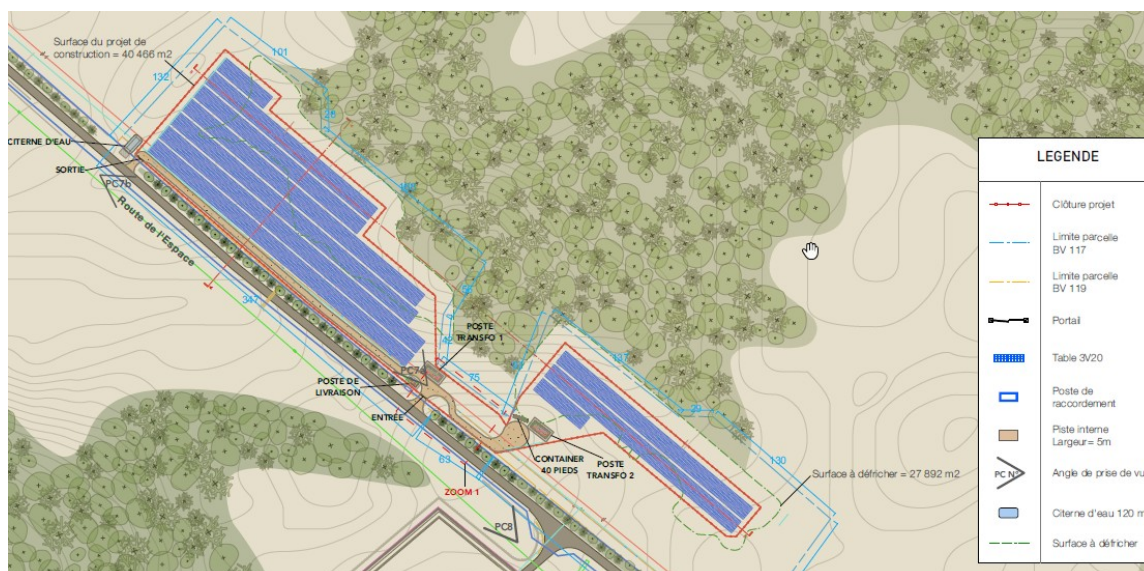
Figure 1 : Plan des aménagements du parc photovoltaïque PV2

L'étude d'impact n'est pas très claire quant à la réalisation des voies de circulation. En effet, la piste prévue pour accéder au chantier ne serait pas goudronnée mais recevrait une couche empierrée perméable permettant d'augmenter la portance. L'étude d'impact ne dit pas si cette couche sera retirée à la fin du chantier. Il n'est pas précisé par ailleurs si des véhicules pourront être amenés à circuler le long de la clôture, où une distance de 4 m sera maintenue jusqu'aux panneaux.