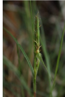
Figure 6 : Exochogyne amazonica

Le risque de dérangement de l'avifaune lors de la nidification n'est pas négligeable. Au moins 19 espèces d'oiseaux sont identifiées comme nicheurs possible sur le site ou à proximité immédiate, dont 9 espèces qui présentent un enjeu fort ou très fort de conservation. Les enjeux les plus importants étant dûs à la présence de la bécassine géante ( Gallinago undulata ), du sporophile gris-de-plomb ( Sporophila plumbea ), et du tangara à galons rouges ( Tachyphonus phoenicius ). Le CSRPN souligne dans son avis l'omission du ara macavouanne de la liste des oiseaux impactés par le projet.